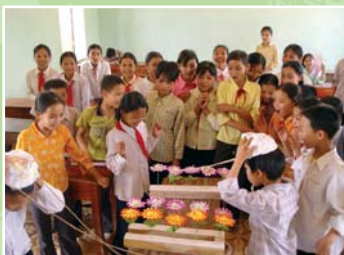
Giáo dục môi trường tại cộng đồng