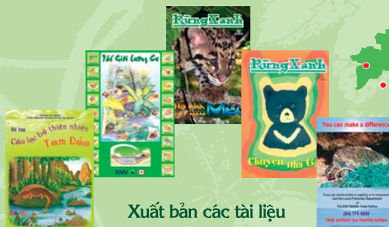
Xuất bản các tài liệu giáo dục môi trường